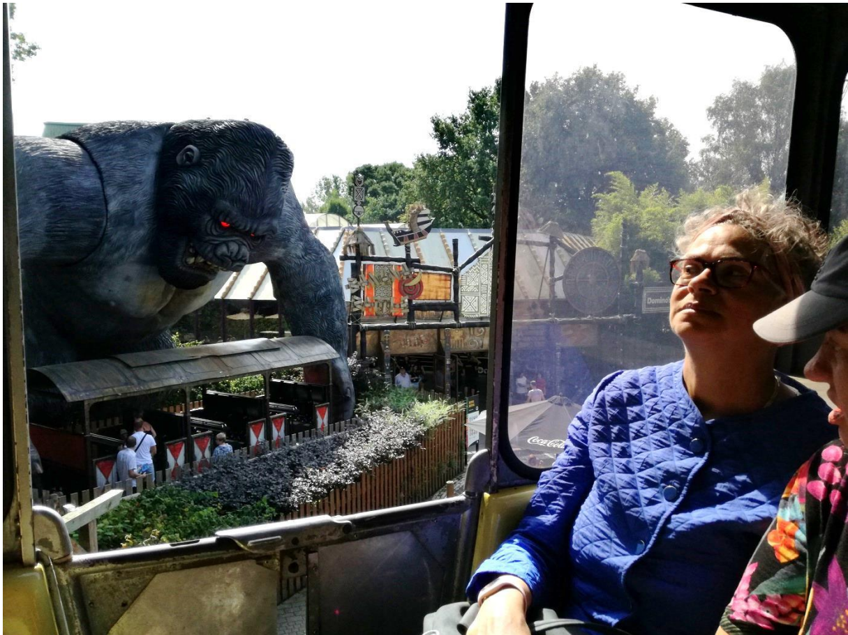
Ingrid zat in de trein en zag ineens KingKong!