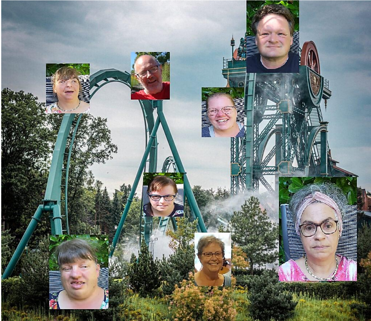
Dit was een erg warme vakantie voor waaghalzen en bedachtzamen. Met een foto kun je wel in 'de Baron'.